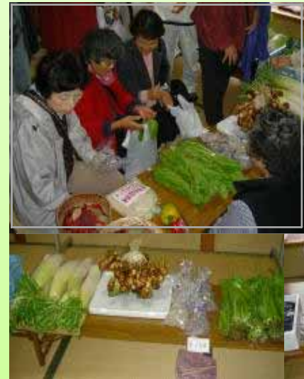
農産物は首都圏からの奥様方に大好評