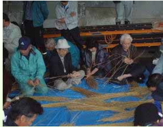
縄ない体験は先生がいっぱい