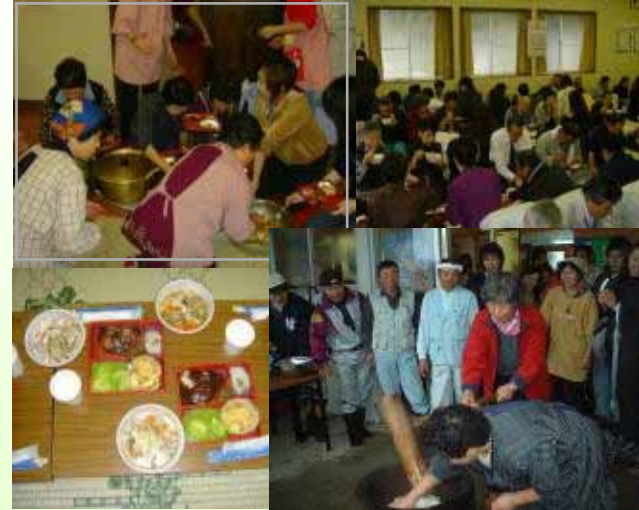
餅つき体験と餅料理での昼食交流