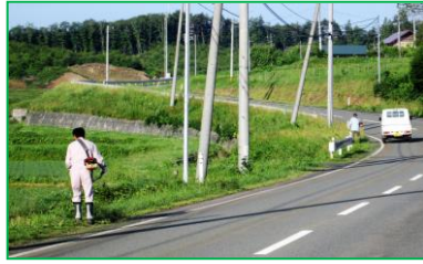
県道の草刈り作業

今回は、雑貨屋KOMASAさんにイベントプロデュースを依頼し、前庭のテントでの様々なジャンルの出店ブースや、楽器演奏、フラダンスの発表など、盛り沢山の催しを提供し、地域内外からの多くの来場者で賑わいました。 古曲田家をもっといろいろなことに有効活用できるよう、今回のイベント開催をきっかけにして、これからも企画検討してまいります。